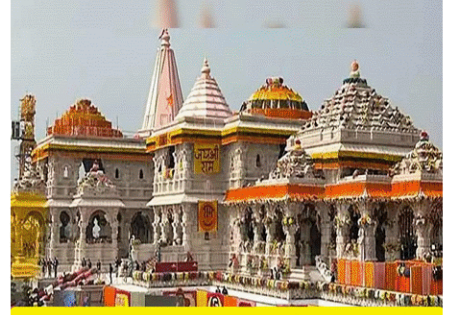
Tata Sons to Build ₹650 Crore 'Museum of Temples' in Ayodhya

(D) उत्तर प्रदेश कैबिनेट ने अयोध्या में मंदिरों का संग्रहालय बनाने के लिए टाटा संस के प्रस्ताव को मंजूरी दे दी है, यह परियोजना 650 करोड़ रुपये की है और इसे टाटा के कॉरपोरेट सामाजिक उत्तरदायित्व फंड के माध्यम से वित्त पोषित किया जाएगा। इसके अतिरिक्त राज्य कैबिनेट ने अयोध्या में आगे के विकास कार्यों के लिए 100 करोड़ रुपये की मंजूरी भी दी है।