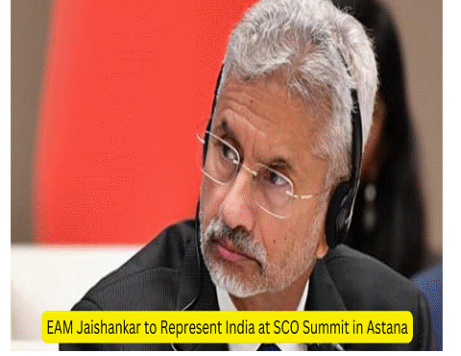
EAM Jaishankar to Represent India at SCO Summit in Astana

(A) विदेश मंत्री एस. जयशंकर अस्ताना में शंघाई सहयोग संगठन के वार्षिक शिखर सम्मेलन में भारत का प्रतिनिधित्व कर रहे हैं। उम्मीद है कि 3 से 4 जुलाई को हो रहे शिखर सम्मेलन में क्षेत्रीय सुरक्षा स्थिति और संपर्क एवं व्यापार को बढ़ावा देने के तरीकों पर ध्यान केंद्रित किया जाएगा। कजाकिस्तान समूह के वर्तमान अध्यक्ष के रूप में अपनी क्षमता में शिखर सम्मेलन की मेजबानी कर रहा है।